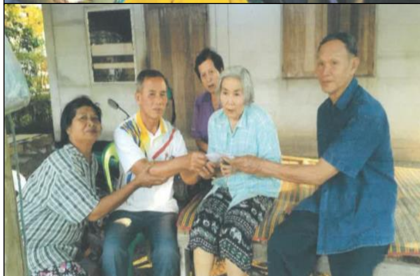
โครงการเพื่อนเยี่ยมเพื่อน ดูแลสุขภาพชมรมผู้สูงอายุ