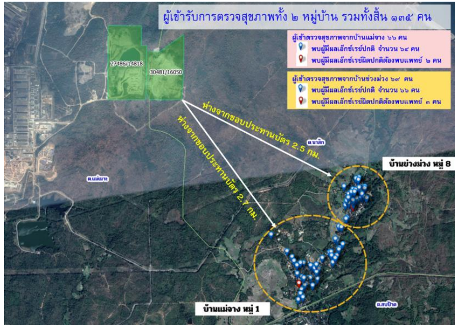
รูปที่ ๑ แผนที่แสดงความเชื่อมโยงระหว่างที่ตั้งชุมชนกับข้อมูลผลการตรวจ X-Ray ผิดปกติ ที่ประชุมรับทราบ