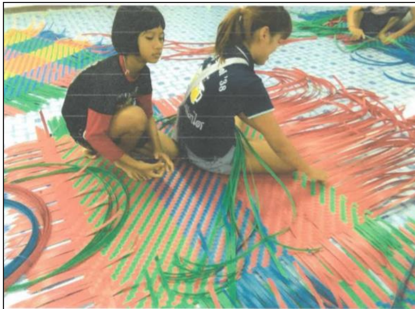
โครงการสนเสื่อเทปสี และตะกร้า