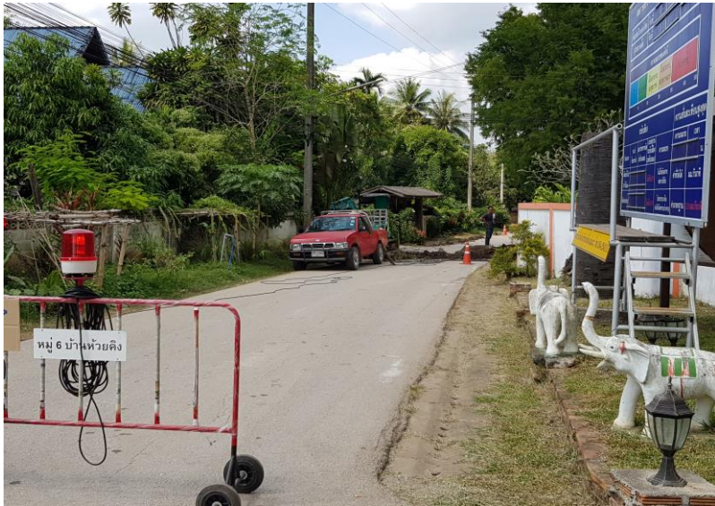
โครงการขุดลอกรางระบายน้ำ บ้านห้วยคิงหมู่ ๖