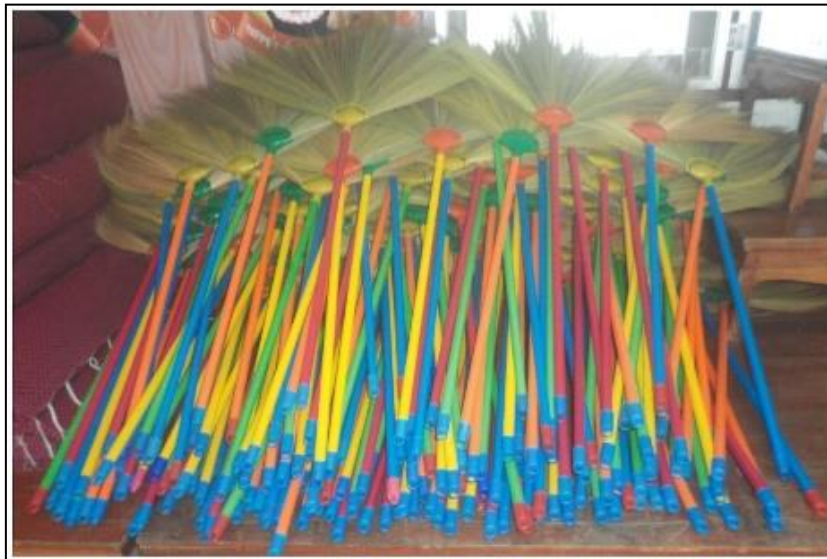
โครงการทำไม้กวาดอ่อน (ดอกหญ้า)