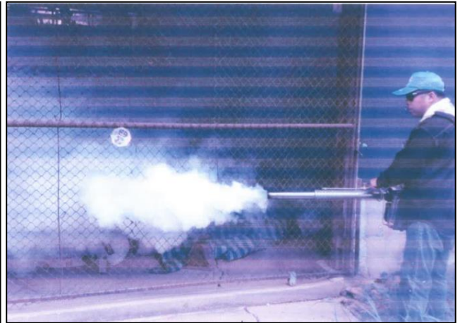
กิจกรรมโครงการจัดซื้อเครื่องพ่นยากันยุง และอุปกรณ์สำหรับ อสม.