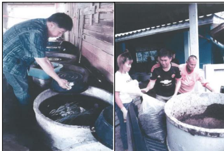
กิจกรรมโครงการคัดแยกขยะเปียกโดยใช้ไส้เดือน