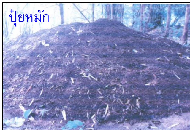
กิจกรรมโครงการปลูกผักสวนครัวรั้วกินได้