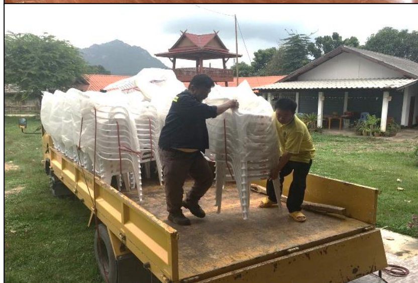
โครงการจัดซื้อเก้าอี้นั่งอย่างหนาเพื่อมัสยิดสาธารณะประโยชน์ในหมู่บ้าน