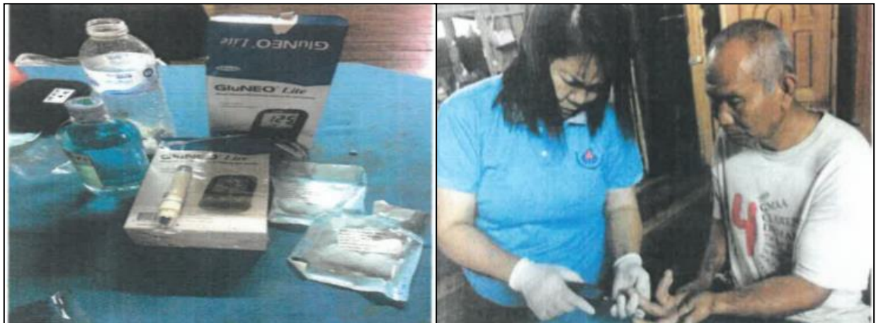
โครงการจัดซื้ออุปกรณ์ สำหรับ อสม. หมู่บ้านห้วยคิง